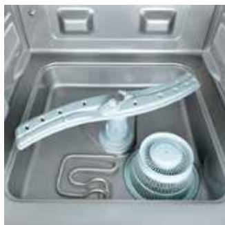
Volumen de cuba compacto Máxima eficiencia.