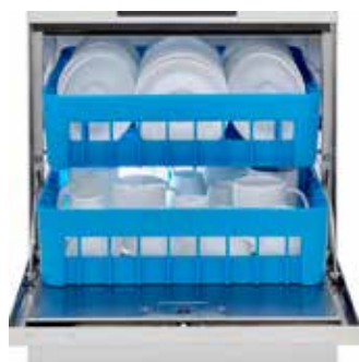
Opción de doble altura Añade el accesorio de doble altura y duplica la producción de tu lavavajillas.