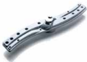
Brazos de lavado Hydroblade Ahorro de agua, eficacia de lavado, resistencia y durabilidad.