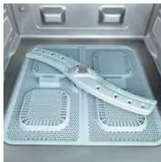
Filtros de superficie "easy-on" Montaje y desmontaje extremadamente fácil.