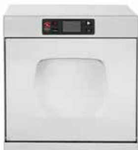
Puerta "easy-grip" Diseño con asa integrada en la puerta.