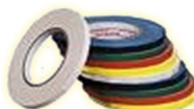
PACK DE 24 CINTAS PARA CIERRABOLSAS.